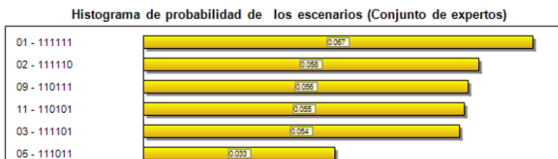
Figura 1 Histograma

Con el procesamiento de la SMIC se obtiene en el histograma de probabilidad de realización de los escenarios constatándose que de los 64 escenarios todos tienen probabilidades de ocurrencia y constituyen el campo de los escenarios realizables, de ellos se toman los 6 de mayores probabilidades de ocurrencia