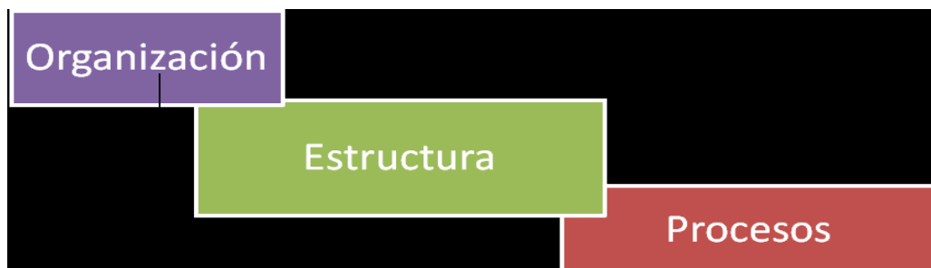
Figura 1.2.- Las 3 variables conceptuales también se imbrican en sus propias definiciones.