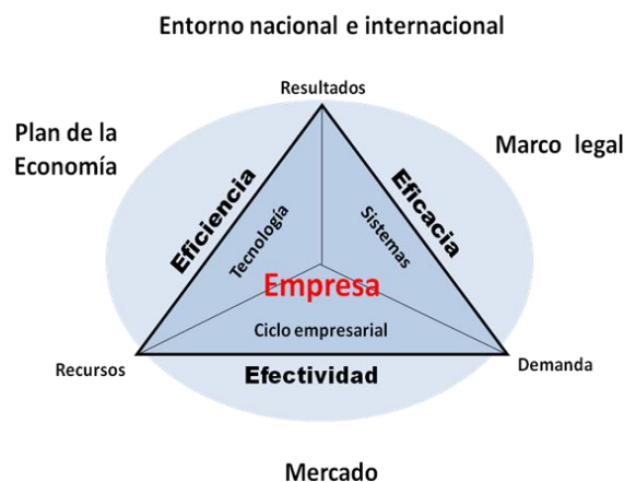
Figura 1. Relaciones entre la eficiencia, eficacia y efectividad

El propósito es valorar el impacto del sistema de superación en los cuadros de la 1ra edición de los Diplomados de Dirección y Gestión Empresarial y Administración Pública, diseñado bajo esta concepción, nos propusimos el estudio de sus elementos fundamentales: la efectividad, la eficacia y la eficiencia.