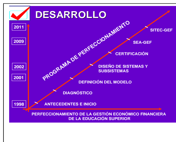
Figura 3: Programa de Perfeccionamiento de la Actividad Económico- Financiera. Fuente: Elaboración propia

En cada universidad fue creado un modelo propio de GEF. (Figura 3: Programa de Perfeccionamiento de la Actividad Económico- Financiera. Fuente: Elaboración propia)