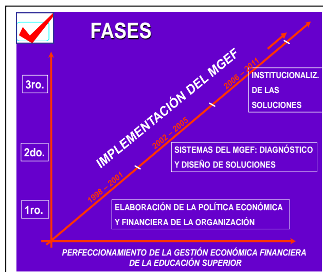
Figura 1: Fases del MGEF: Fuente: Elaboración propia.

La implementación del MGEF es un proceso de sistematización y ordenamiento, para lo cual fueron definidas tres fases. (Figura 1: Fases del MGEF. Fuente: Elaboración propia)